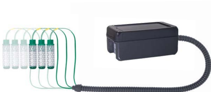
Der PiCUS Tension kann mit bis zu sechs robusten Sensoren ausgestattet werden

Die Messdaten werden bei Nutzung des LTE Funkstandards in der PiCUS Environmental Cloud gespeichert und können tagesaktuell über die PEC App oder die browserbasierte Anwendung eingesehen werden. Der Standort des Cloudservers ist bei IML Electronic in Rostock. Dadurch wird die Auswertung der Messinformationen durch individuelle Exportfunktionen erweitert. Bei der LoRaWAN® Ausstattungsvariante werden die Messdaten vom PiCUS Tension in das benutzereigene LoRaWAN® Netzwerk gesendet und können dort abgerufen werden.